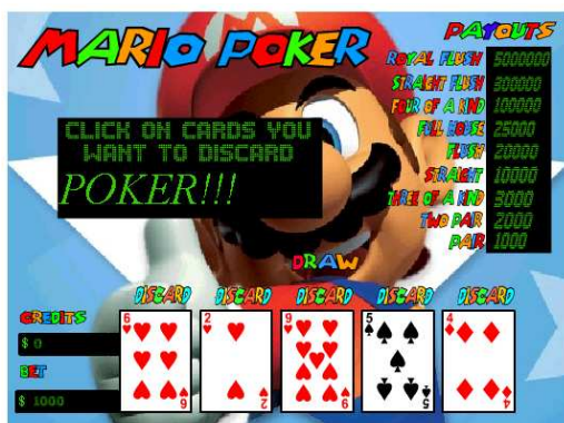
Abbildung 4: "Kindgerechtes" Pokerspiel um virtuelles Geld als Flashspiel

Auf vielen Flashspiele-Seiten, welche Skill-Games anbieten, bekommen Kinder und Jugendliche durch das Genre „Casino“ auch erste Kontakte zu Glücksspielen. Im Gegensatz zu kommerziellen Glücksspiele-Seiten wird hier gegen den Computer und um virtuelle Einsätze gespielt.