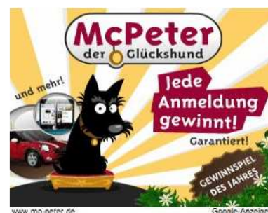
Abbildung 6: Der "Glückshund" verlockt zum Draufklicken.

Abgesehen von der generellen Bedenklichkeit der meisten Werbeaussagen, wird zudem mit Rabatten, Gewinnspielen und Geldpreisen geworben. In einem Werbebanner beispielsweise lockt ein kleiner niedlicher Hund damit, dass jede Anmeldung garantiert gewinnt. Nutzer werden meist mit „du“ angeredet, wodurch sich Kinder besonders angesprochen fühlen.