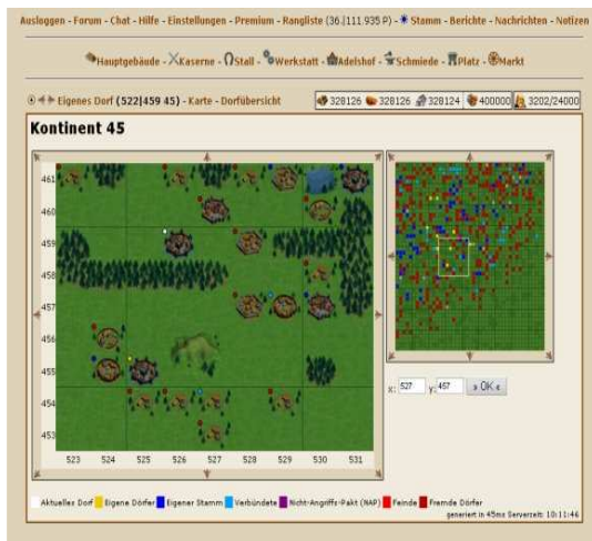
Abbildung 1: Das Browserspiel "Die Stämme" (Bildquelle: http://www.diestaemme.de/intro.php?page=2&ref=intro )

Ein Browserspiel (englisch: „browser-based game“ oder „browser game“) ist ein länger andauerndes Online-Spiel, das mittels eines normalen Web-Browsers wie dem Internet Explorer oder Firefox gespielt werden kann. In der einfachsten Form erfolgt die Berechnung des Spielgeschehens vollständig auf den Servern des Spiele-Anbieters, wodurch keine Software-Installation auf dem heimischen Rechner erforderlich ist. Das Spiel eines Browserspiels ist nicht an einen festen Spielort, wie beispielsweise den eigenen Rechner gebunden, sondern kann auf jedem internetfähigen Rechner gespielt werden. Gerade diese Mobilität könnte auch ein entscheidender Grund für die stetig wachsende Beliebtheit der Browserspiele sein.