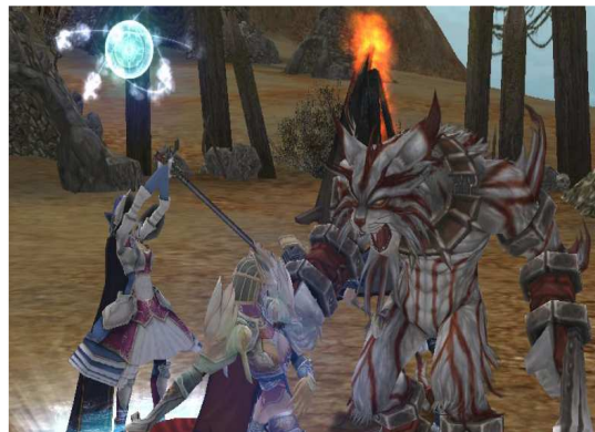
Abbildung 2: Rappelz, ein grafisch anspruchsvolles Onlinerollenspiel

In diesem ausschließlich über das Internet spielbaren Fantasy-Rollenspiel-Genre bevölkern gleichzeitig mehrere tausend Spieler eine virtuelle Welt. Server verwalten die Spielwelt und deren Bewohner. Diese setzen sich aus von Spielern gesteuerten elektronischen Stellvertretern („Avatare“) und aus vom Programm gesteuerten Charakteren („Non-Player-Characters“, kurz: NPCs) zusammen. Inhaltlich sind die Spiele mit Computer-Rollenspielen vergleichbar, legen aber aufgrund ihres Online-Aspektes einen höheren